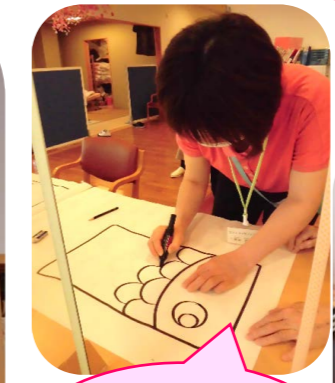
職員が真剣に下絵を描きました♪