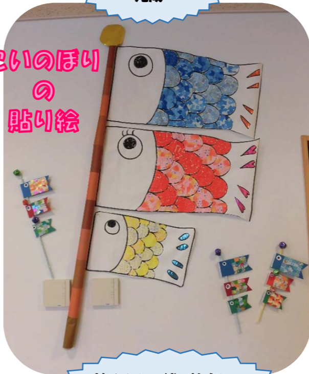
皆さんと一緒に協力してこいのぼりの大きな貼り絵が完成しました♪