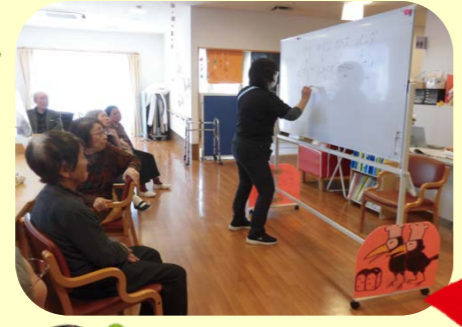
お茶を飲みながらホワイトボードを使い頭の体操☆