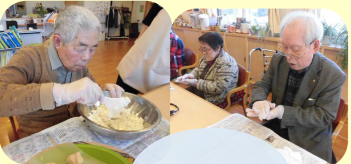
白玉粉と豆腐を混ぜて♪こねて♪