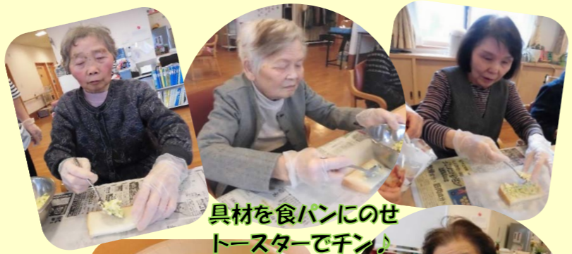
具材を食パンにのせトースターでチン♪