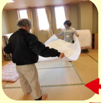
職員と一緒に布団のシーツ交換ありがとうございました!!