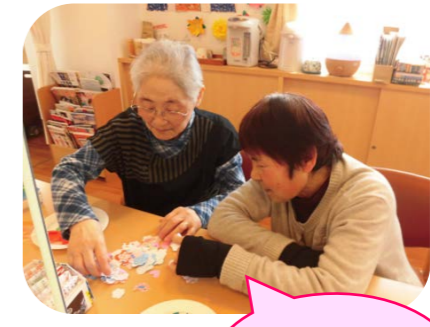
どれにしようかな?