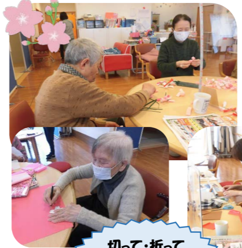
切って・折ってねじって・繋げて完成♪