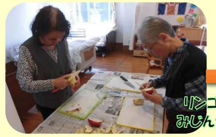
リンゴをみじん切り