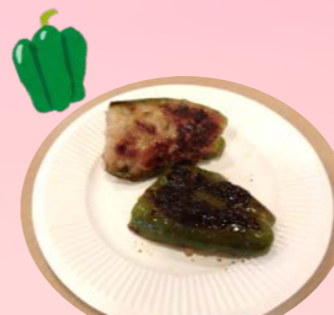
はんぺんで作る ピーマンの肉詰め

季節を感じていただける調理レクを交えながら、皆さんと一緒に楽しく行えるメニューを考えています♪ 今回『ちまき作り』では、手順を思い出しながら作る方、「忘れちゃったなあ〜」と言われるながらも思い出しながら作る方、利用者様同士教え合いながら作る姿も見られていました。