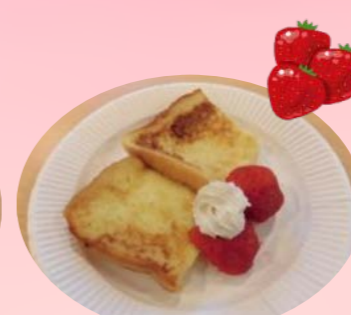
フレンチトースト イチゴ添え