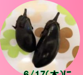
6/17(木)に 第一弾となる 『なす』を収穫!