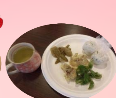
山菜の天ぷらと 青菜ご飯おにぎり