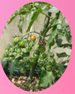
ミニトマト 赤く色づいてきました!