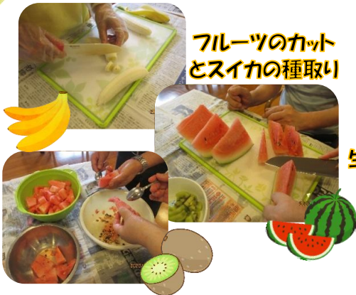
フルーツのカット とスイカの種取り