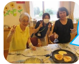
焼き終わりを 待つ間に3人で ハイチーズ♪