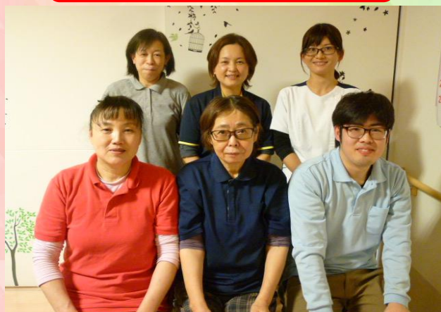
Cユニット職員・栄養士

ご面会をお待ちしております。 面会時間：10：00～11：00 14：00～16：00