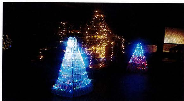
てまりデイサービスセンター 正面玄関