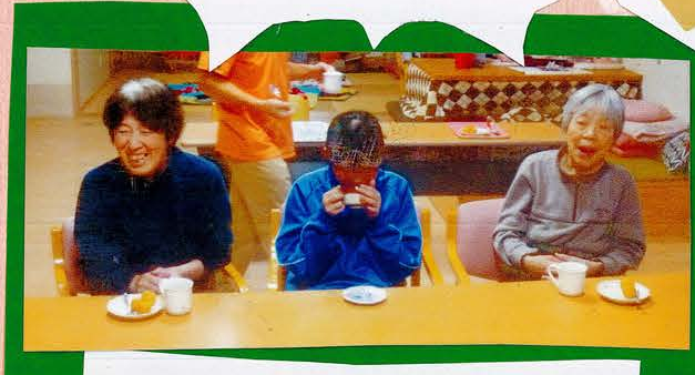
中学生とのおやつタイム♪♪

11月20日(水)に「さつまいもドーナツ」作りをし、勉強に来ていた刈谷田中学校の生徒さん達と楽しく話をしながら調理しました。見た目も味もとてもよく出来、「今までの調理レクの中で一番美味しい!」と大好評でした。