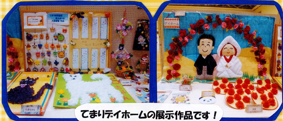
てまりデイホームの展示作品です！

11月15日(金)～17日(日)の3日間 栃尾市民体育館にて 栃尾美術展が行 われました。てまり デイホームでも日 頃の作品づくりの 成果を発表・展示 しました。