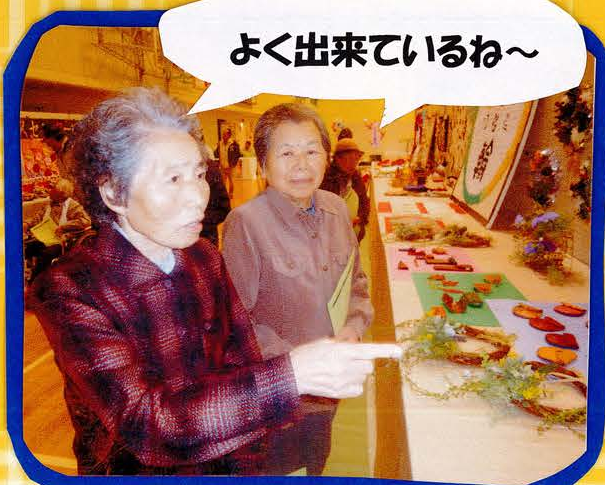
よく出来ているね～