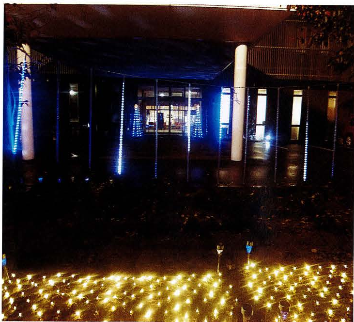
てまり総合ケアセンター 正面玄関

ご利用者、地域の皆様に『光の世界』を楽しんでいただければと思い、今年も クリスマスイルミネーション を開催しました。色とりどりのLEDライトをペットボトルに絡めたクリスマスツリーや、線状にして建物や庭木に飾り付けた光の絨毯を演出してみました。