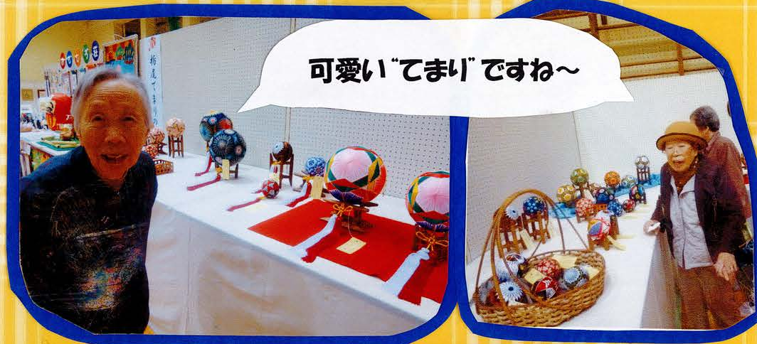
可愛い"てまり"ですね～

16日(土)には、ご利用者様と一緒に見学に行きました。他者の作品を見て関心されたり、自分達の作った作品が飾られているのを見て達成感を感じられていました。