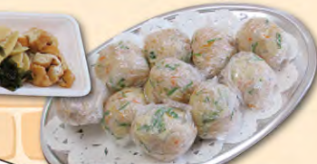
頭と体を使った後はスイーツやたけのこご飯をおいしくいただきました