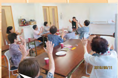
理学療法士による講話