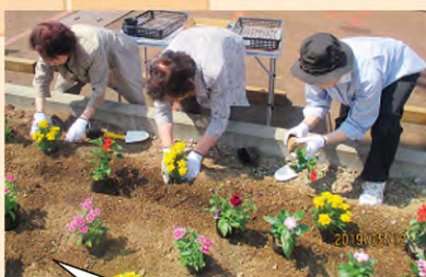
花壇に花を植えていただきました