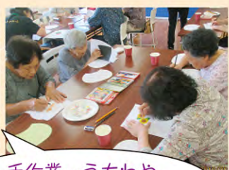
手作業…うちわやキーホルダーを作りました

5月より月1回開催している”オレンジカフェ”今年度も楽しい内容で行ってまいります。ぜひ一度足をお運びください。お待ちしております。