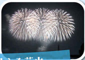
モス・コーラから見える花火