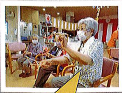
おらっておらって~