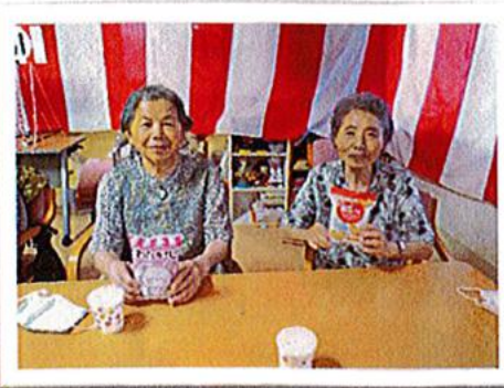
景品は駄菓子です♪