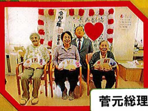
菅元総理大臣!?と記念撮影☆

9月21日(火)にデイホーム敬老会を行いました。当日は楽しい紙芝居の他、長寿番付の発表や職員の変装に大盛り上がり！長寿横綱vs大横綱の取り組みもあり、皆様楽しい一時を過ごされていました。