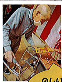
のしいか 当たったよ